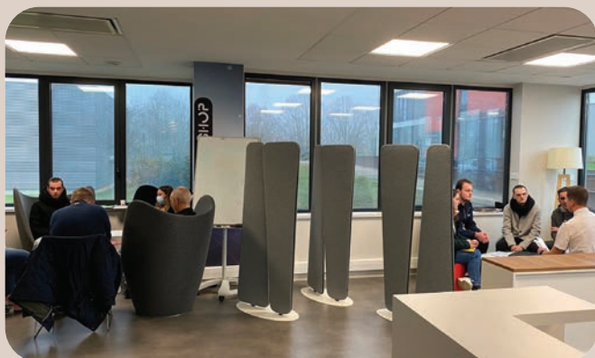
Espace co-working FLTech

Un forum pour l'emploi pas comme les autres a été organisé dans les locaux de l'espace de co-working FLTech par la Communauté de Communes du Bassin de Pompey et la Mission locale du Val de Lorraine. Originalité de la démarche : ce sont les employeurs qui sont venus à la rencontre des demandeurs d'emploi. D'où son nom : un forum inversé.