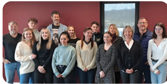
Accueil des apprentis à Delta Affaires