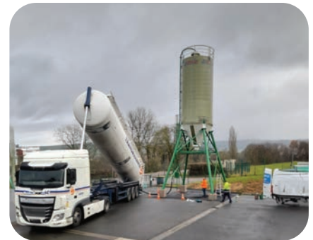
Centre technique du Bassin de Pompey - Pompey

Le Bassin vient de se doter de deux silos à sel de 60 tonnes (à Pompey) et 30 tonnes (à la composterie). Ces équipements offrent des conditions optimales de stockage du sel pour garantir une meilleure qualité et faciliter l'approvisionnement des engins de désalage.