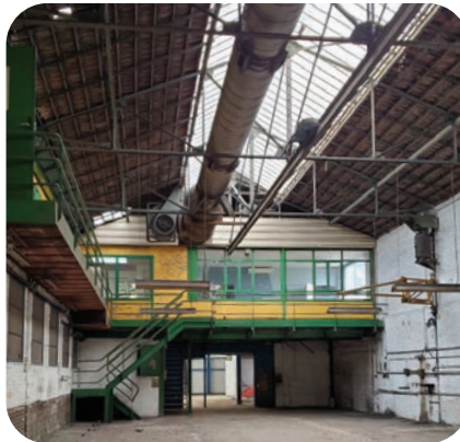
Sercam - Pompey

Le Bassin de Pompey envisage d'acquies de nouveaux véhicules, en priorité électriques, pour remplacer les navettes affrétées pour le service de transport à la demande (TAD) du réseau LeSIT, répondant ainsi aux enjeux de décarbonation. Un test en conditions réelles, réalisé avec un véhicule prêté à titre gratuit pendant une semaine fin novembre, a permis d'étudier la faisabilité d'une exploitation et d'en évaluer les contraintes et les avantages. Les premiers retours sont positifs pour les passagers en termes de confort, de bruit et d'aménagement intérieur. La typologie du relief du territoire du Bassin de Pompey impose néanmoins une réflexion plus approfondie en raison du temps de recharge des véhicules.