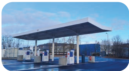
Station multi-énergies - Champigneulles

Tout comme l'ouverture en ce début d'année d'une station multi-énergies à Champigneulles. En partenariat avec ENGIE Solutions, cette station permet, dans un premier temps, à l'ensemble des habitants et entreprises de se fournir en gaz naturel pour véhicules.