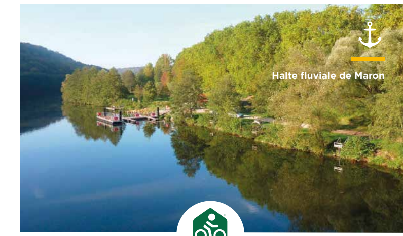
Halte fluviale de Maron