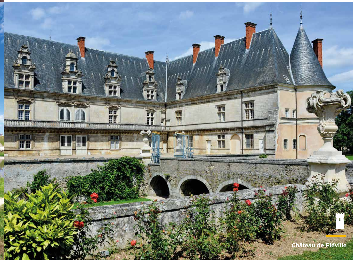
Château de Fléville

Op de route van de 'Boucle de la Moselle' komt men een rijk historisch erfogoed tegen: religieuze gebouwen zoals de kathedraal van Toul, Place Stanislas in Nancy (UNESCO), Art nouveau, de middeleeuwse stad Liverdun, karakteristieke Lotharingse dorpjes waaronder Villey-Saint-Etienne, musea, militair erfogoed, kastelen zoals die van Fléville.