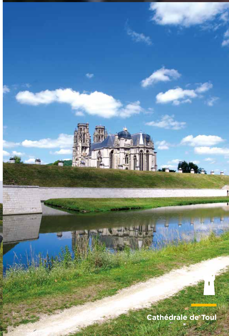
Cathédrale de Toul