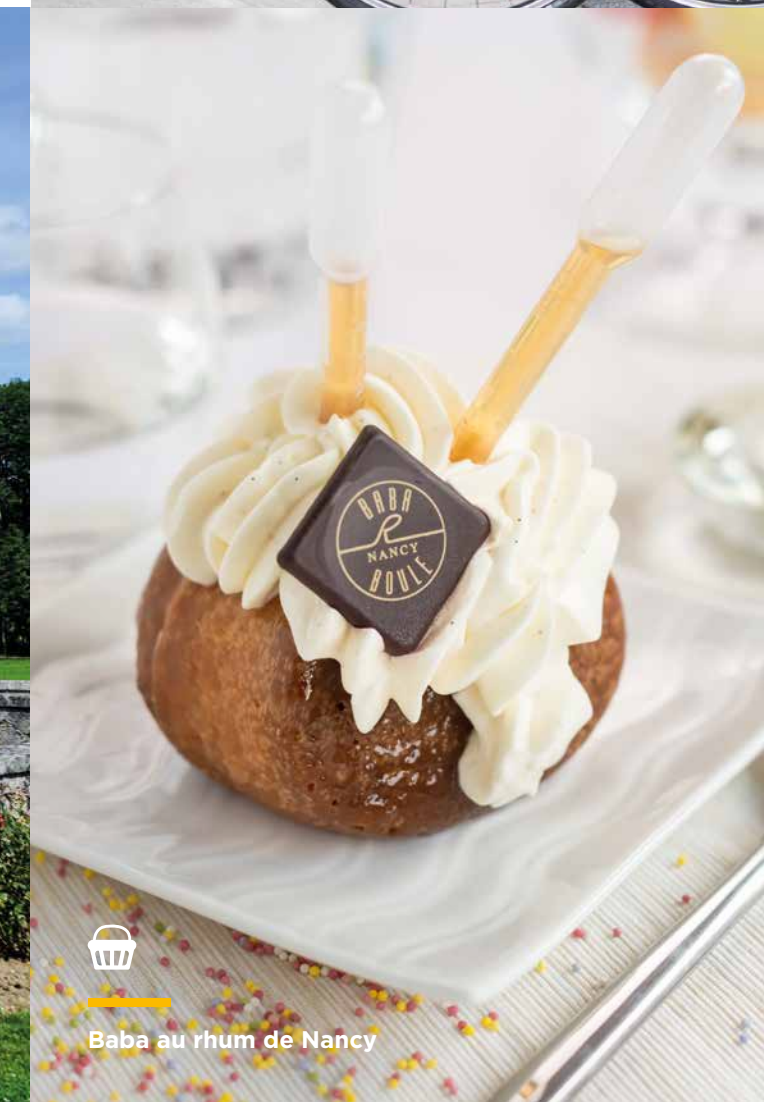
Baba au rhum de Nancy

Door de industrie en in het bijzonder de staalindustrie in Neuves-Maisons en Pompey veranderde uiteraard het landschap maar steeg dit gebied in aanzien. Er zijn wandelroutes uitgezet als eerbetoon aan de vroegere staalwerkers, een voorbeeld hiervan is de 'Chemin des Traces' in Neuves-Maisons, deze route verbindt de gesloten mijn met de fabriek die nog steeds in bedrijf is (de Val du Fer-mijn kan men het gehele jaar bezoeken), en het circuit van Pompey biedt een aanvullende referentie. Andere bewijzen van dit industriële verleden zijn de Moezel, een aaneenschakeling opmerkelijke sluisen tussen Nancy en Neuves-Maisons en het IJzermuseum in Jarville-la-Malgrange dat de staalgeschiedenis van de regio gestalte geeft.