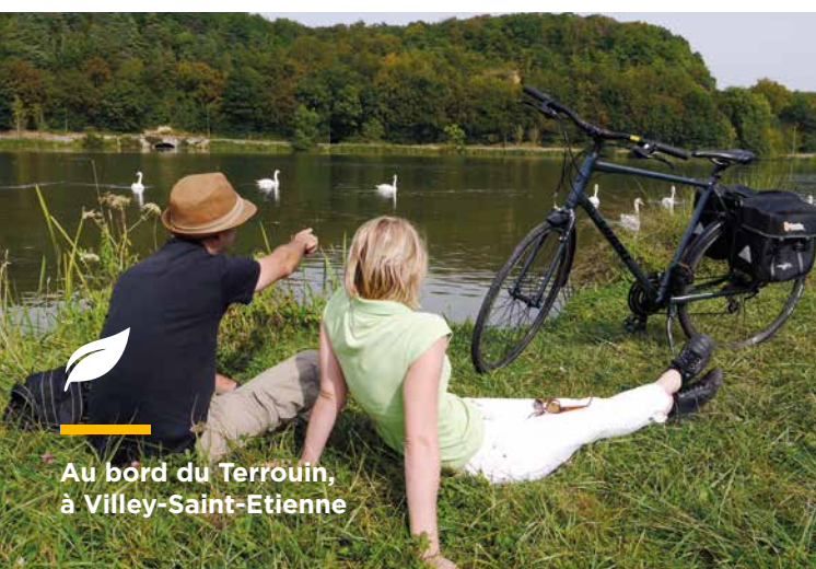
Au bord du Terroulin, à Villey-Saint-Etienne

Het bosgebied 'Forêt de Haye' strekt zich uit in het hart van de lus van de Moesel over meer dan 10.000 hectare, ideaal om te wandelen en om bij te tanken.