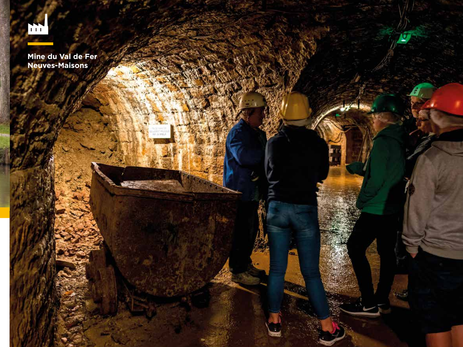
Mine du Val de Fer Neuves-Maisons

Als mirabelpruimen, madeleines (cakejes), bergamotsnoepjes en macarons o.a. de bekendste streeklekkernijen zijn, zijn andere zoete specialiteiten ook zeker de moeite van het proeven waard. Wijnliefhebbers gaan zeker genieten van de Côtes de Toul wijnen en bierfans zullen versteld staan door de verscheidenheid aan regionale biersoorten.