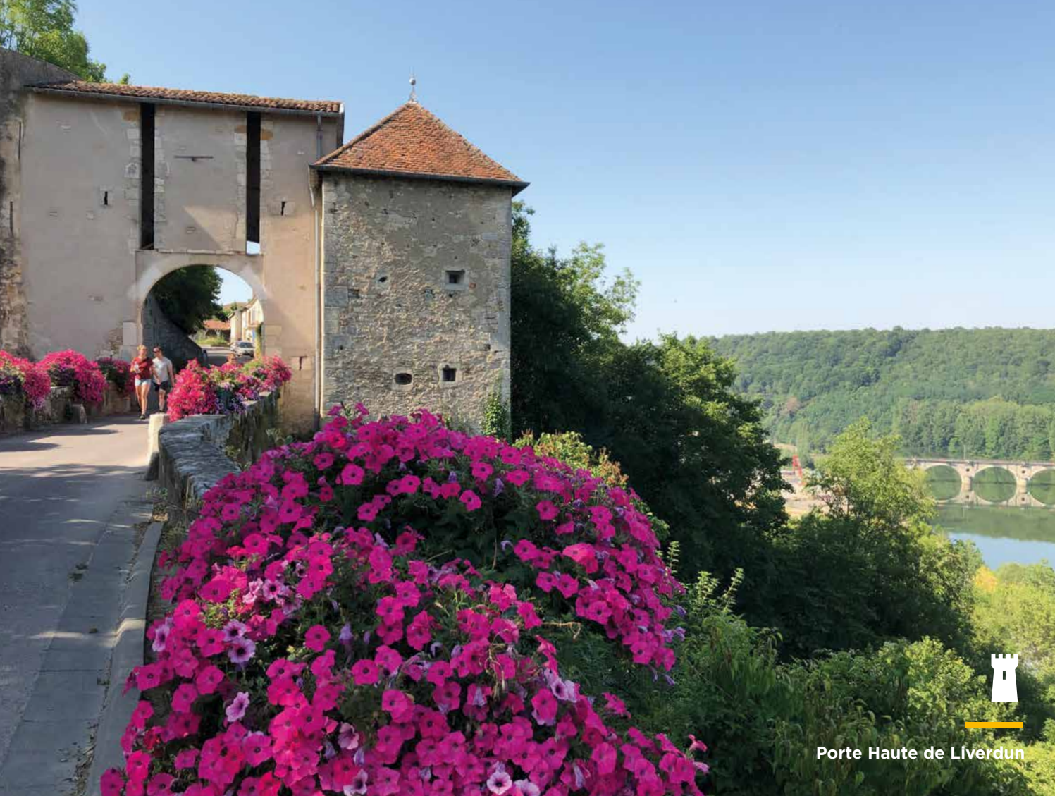
Porte Haute de Liverdun