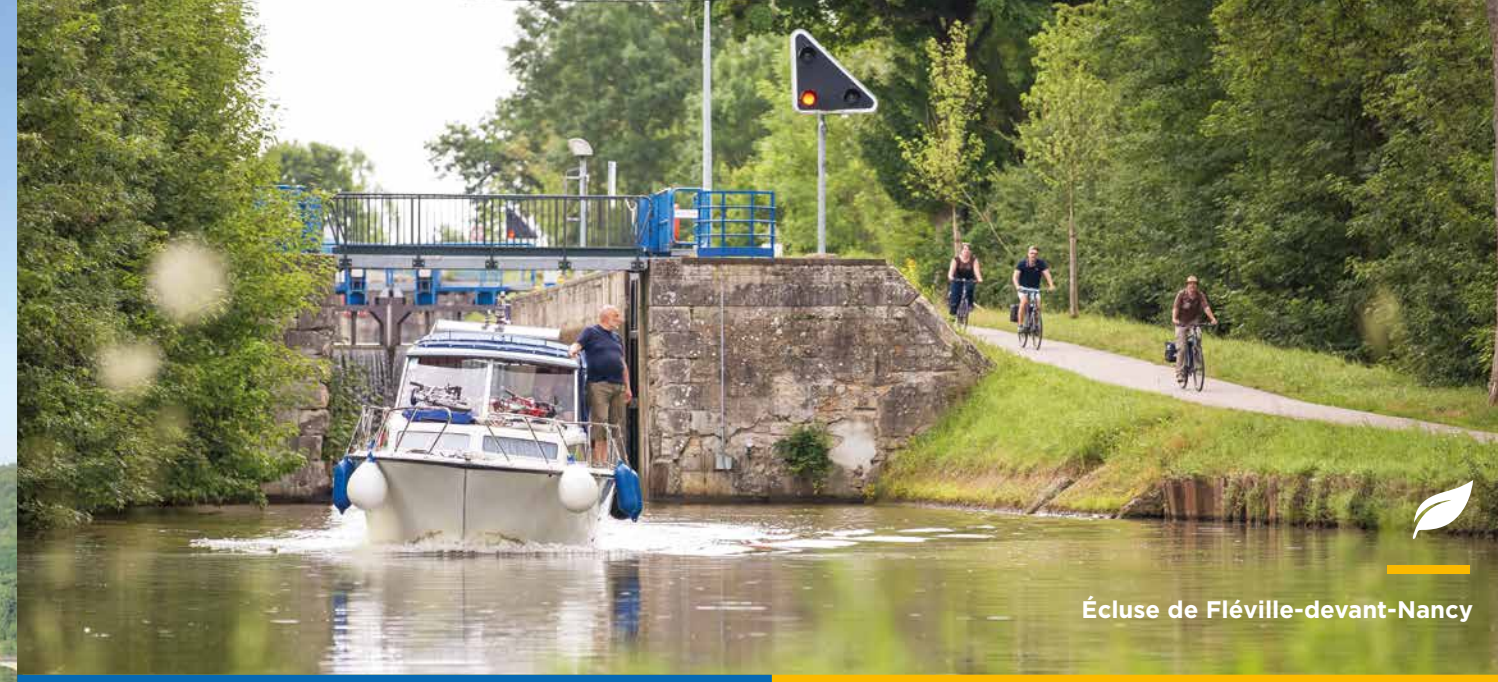
Écluse de Fléville-devant-Nancy